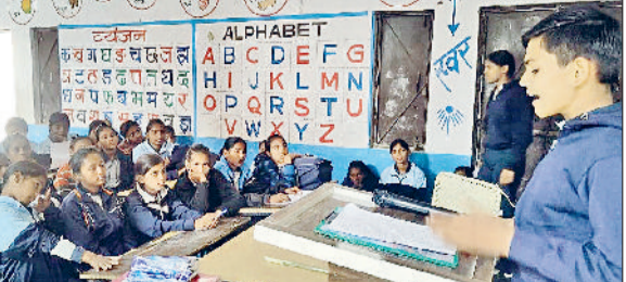
भिवानी। बदलाव की पाठशाला में भाषण प्रतियोगिता में प्रस्तुति देते विद्यार्थी।