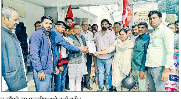
मिवाणी। वेतन व रोजगार न मिलने पर विरोध प्रदर्शन करते व मुख्यमंत्री के नाम ज्ञापन सौंपते हुए एलसीएलओ कर्मचारी।