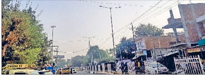
बवानीखेड़ा में खराब पड़ी स्ट्रीट लाइटें।