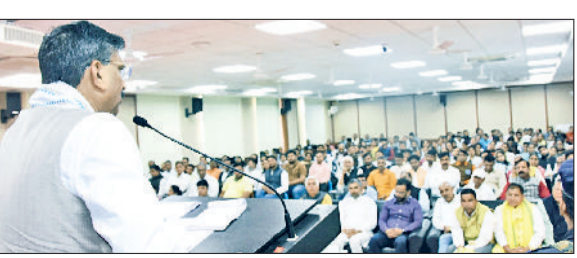
मिवाणी। आयोजित कार्यक्रम में एकत्रित लोगों को संबोधित करते मंत्री।