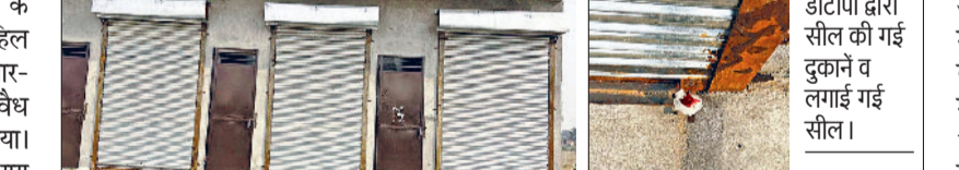
डीटीपी द्वारा सील की गई दुकानों व लगाई गई सील।