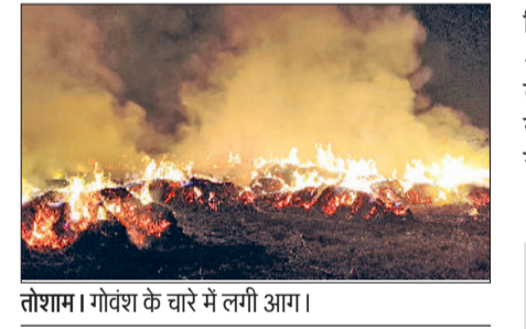
तोशाम। गोवंश के चारे में लगी आग।

हरित पट्टी व अनाधिकृत कॉलोनी में किसी भी प्रकार का अवैध निर्माण न करें। इसी कड़ी में मौजा सिवानी में हिसार-राजगढ़ रोड पर 2.5 एकड़ में बनी अवैध कॉलोनी में बनी पांच दुकानों को सील किया गया है। मौजा सिवानी के किला खसरा नंबर 8/23/2/1, 12/13/2/1, 8/1/2/2/2, 3/1/2, 9/1/1 में फैली अवैध कॉलोनी में कोई व्यक्ति प्लॉट, मकान व दुकान आदि का क्रय-विक्रय न करें, अन्यथा कड़ी कार्रवाई अमल में लाई जाएगी।