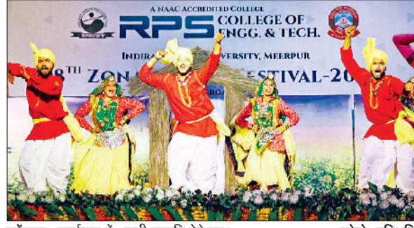
महेंद्रगढ़। कार्यक्रम में अपनी प्रस्तुति देते हुए।