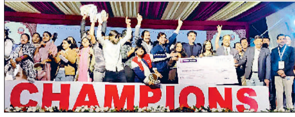
महेंद्रगढ़। विजेता टीम ट्रॉफी के जश्न मनाते हुए।

एकबार फिर से साबित कर दिया है। पूरे जोन के लगभग तीन हजार विद्यार्थी विभिन्न सात मंचों पर अपनी असाधारण प्रतिभा का प्रदर्शन कर रहे थे। विभिन्न कॉलेजों से आए इन प्रतिभागियों ने 46 इवेंट्स प्रतियोगिता में भाग लिया, जिससे यह युवा महोत्सव भारतीय व हरियाणवी संस्कार व धरोहर को दर्शाने वाला एक भव्य मंच सिद्ध हुआ। विश्वविद्यालय की तरफ से युवा महोत्सव विजेता महाविद्यालय को 21 हजार की राशि प्रदान की गई। कार्यक्रम में मुख्यातिथि इंद्रिा गांधी