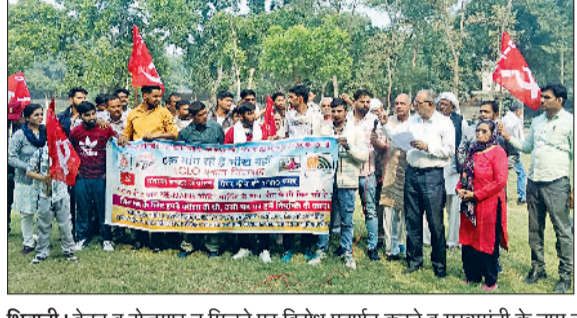
मिवाणी। वेतन व रोजगार न मिलने पर विरोध प्रदर्शन करते व मुख्यमंत्री के नाम ज्ञापन सौंपते हुए एलसीएलओ कर्मचारी।